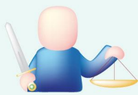
ESTJ besliss- er