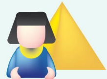
ENTP vernieuw- er